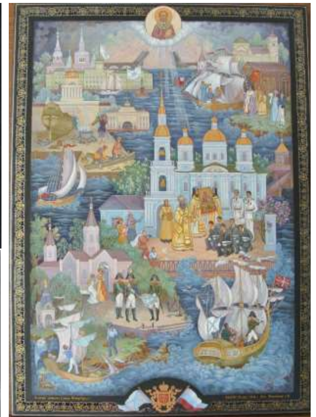
Проект в цвете

Тема 2. Выполнение дипломного художественно-творческого проекта в материале