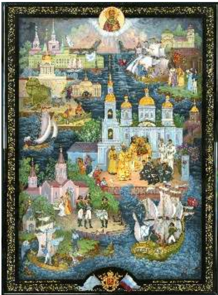
Проект выполненный в материале (на пластине из папье-маше)