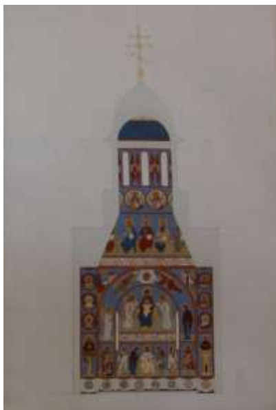
Завершенный проект росписи. Масштаб 1:50