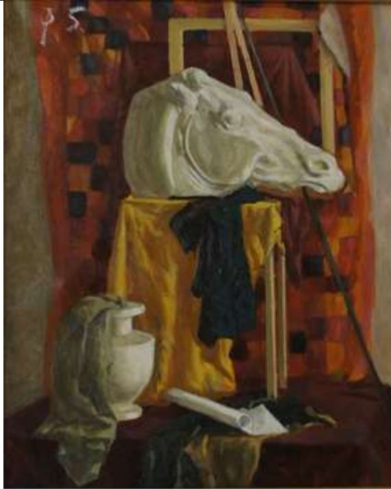
Тональный эскиз натюрморта, формат 10x15, бумага, карандаш 3В