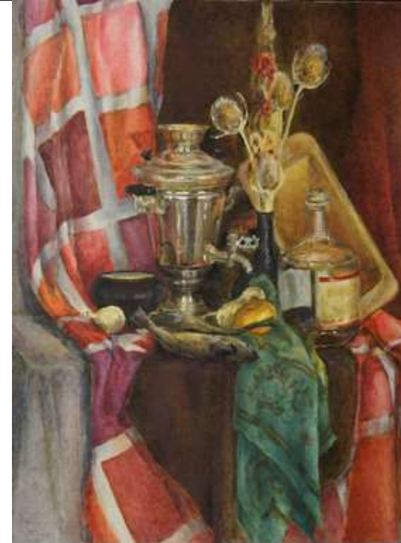
Тональный эскиз натюрморта, формат 10x15, бумага, карандаш 3В

Закрепление угольного рисунка под живопись нейтральными цветами (глауконит, охра, умбра, цинковые белила)