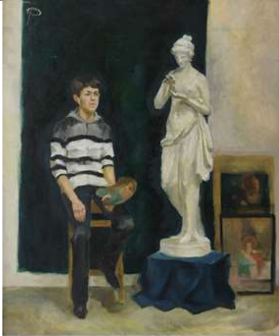
Цветовой эскиз постановки формат 10x20, картон, масло