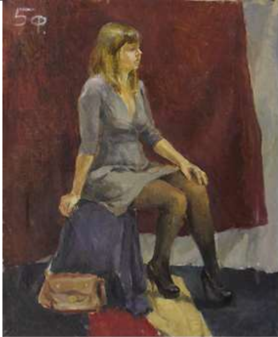
Цветовой эскиз постановки 2 шт., формат 10x20, картон, масло