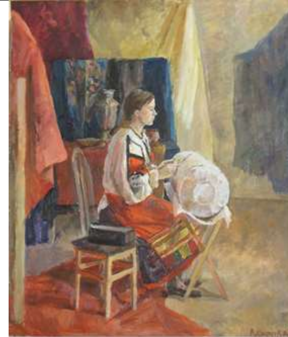
Цветовой эскиз постановки формат 10x20, картон, масло

Лепка деталей постановки (голова) цветом