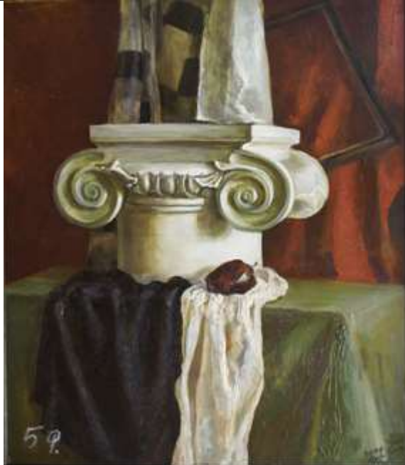
Тональный эскиз натюрморта, формат 10x15, бумага, карандаш 3В