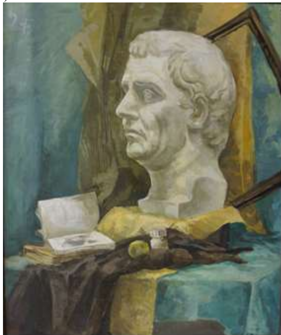
Тональный эскиз натюрморта, формат 10x15, бумага, карандаш 3В