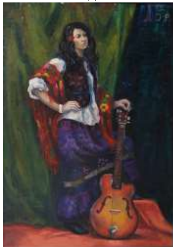
Тоновый эскиз постановки формат 10x20, картон, масло