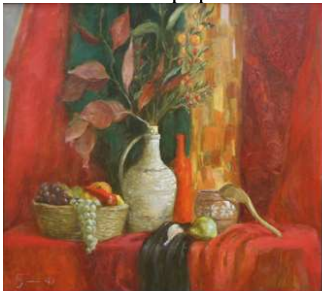
Тональный эскиз натюрморта, формат 10x15, бумага, карандаш 3В