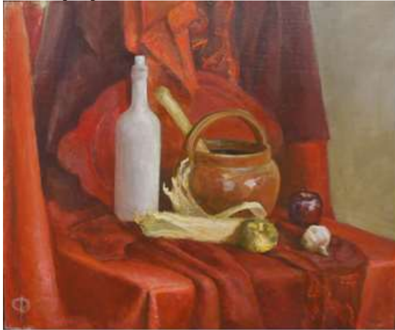
Натюрморт на сближенные цветовые отношения