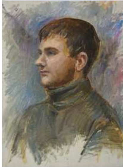
Цветовой эскиз постановки формат 10x20, картон, масло