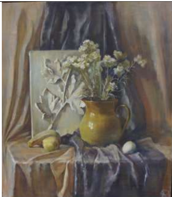
Тональный эскиз натюрморта, формат 10x15, бумага, карандаш 3В