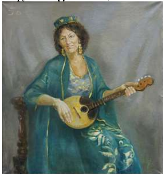
Цветовой эскиз постановки 2 шт., формат 10x20, картон, масло