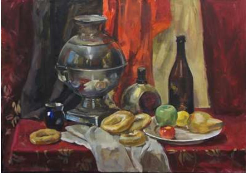
Тональный эскиз натюрморта, формат 10x15, бумага, карандаш 3В